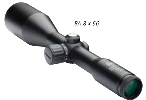
BA 8 x 56

The following is a comparative overview of our rifle scopes' technical data: