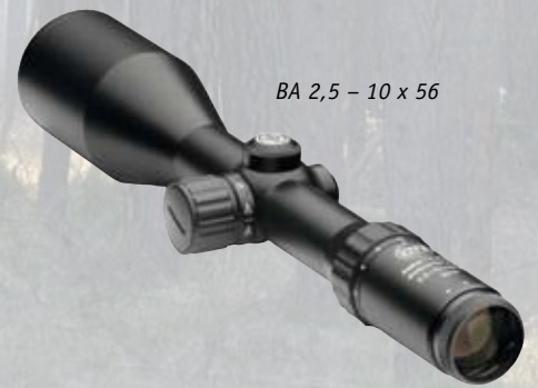
BA 2,5 - 10 x 56