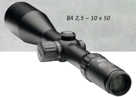
BA 2,5 - 10 x 50